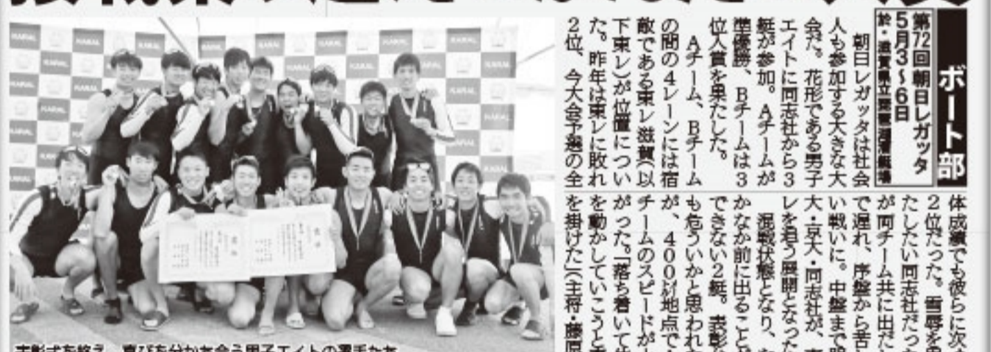
表彰式を終え、喜びを分かち合う男子エイトの選手たち

◆2019/5/6 決勝1000m◆ 順位 チーム レーン タイム 1 東レ遊覧 4 3:04.00 2 同志社A 3 3:09.63 3 同志社B 5 3:11.15 4 関大 6 3:11.20 5 京大 2 3:11.25 6 阪大 1 記録なし