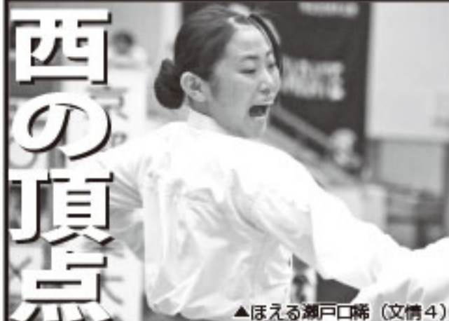
▲ほえる源戸口 (文情4)