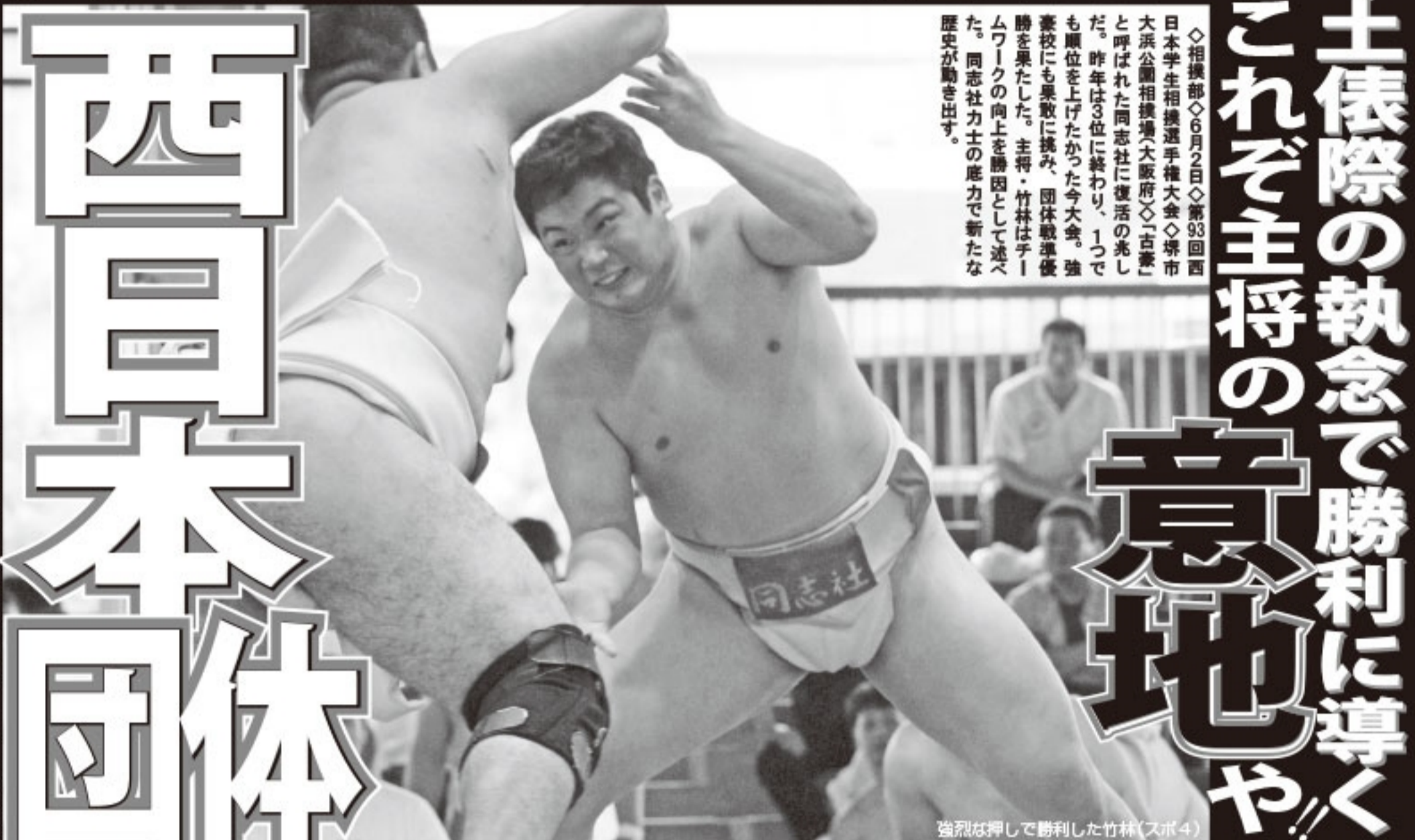
強烈な押しで勝利した竹林 (スポ4)