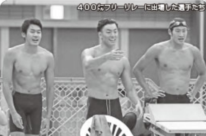
400mフリーリレーに出場した選手たち