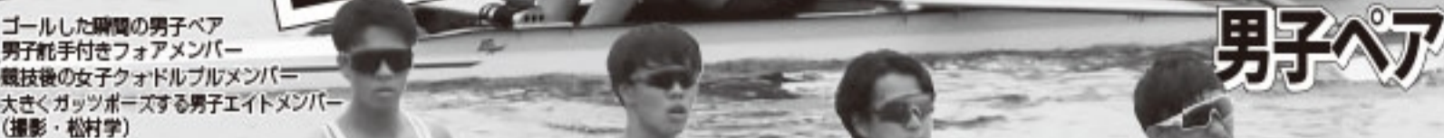
ゴールした瞬間の男子ペア 男子舵手付きフォアメンバー 競技後の女子クワドルプルメンバー 大きくカッツポーズする男子エイトメンバー