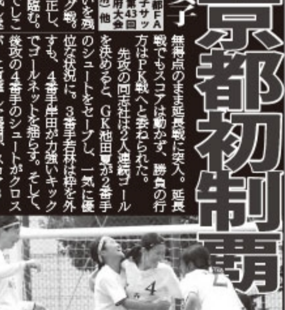
笑顔で抱きしめ合う選手たち

歓喜の京都初制覇 ◆7月18日19日◆第43回全日本女子サッカー選手権大会◆於・アパルコホール(兵庫県)他 1勝4敗1分と悔しい思いを強いられたまま終了した女子サッカー。位を下げた。3選手若林は怪を外す。浮き彫りとなった課題を修正し、万全の状態で京都府大会に臨む。数々の激闘の末、同志社でしごき、京都市初制覇を成し遂げた。2回戦、準決勝ともにPK戦を制し、決勝戦へと進み、決勝で昨年の大会で敗れた明治国際医療に挑む。彼女たちの強豪を倒す。今、同志社に上を目指し、プロフェッショナルを目指し、なりたい。ここで自分自身に、さらなる成長を遂げ、なりたい。この花が咲くのを信じている。