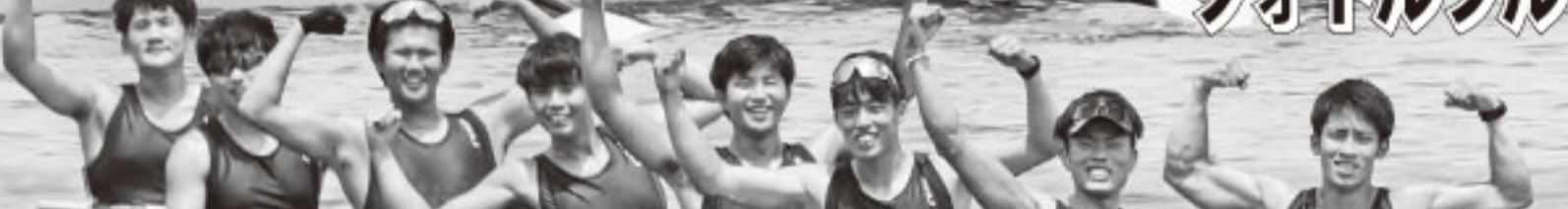
女子クワドルプル